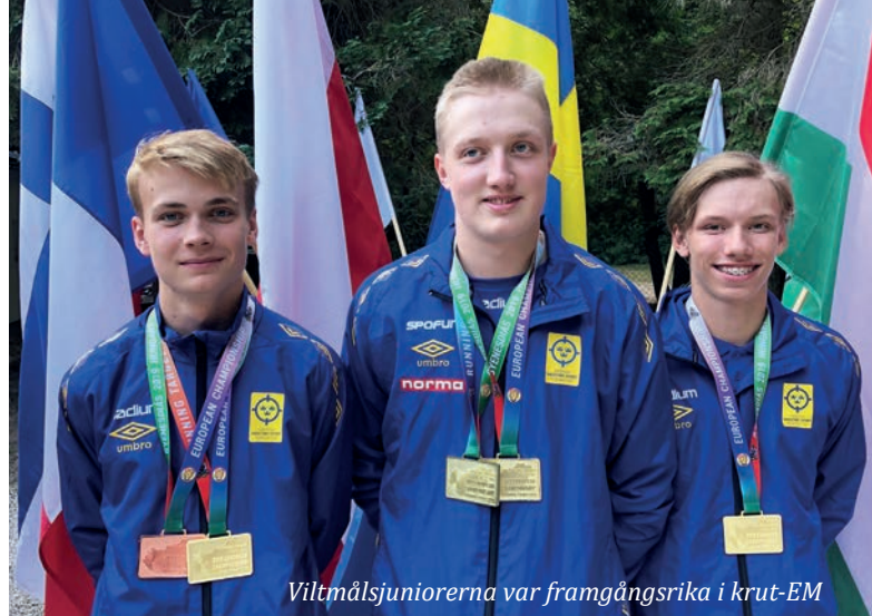
Viltmålsjuniörerna var framgångsrika i krut-EM