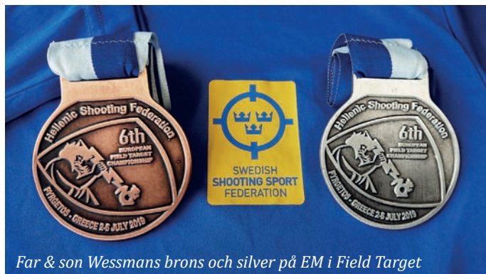
Far & son Wessmans brons och silver på EM i Field Target

Vi har varit bortskämda med medaljer på VM i FITASC Sporting men tyvärr blev vi utan medalj denna gång.