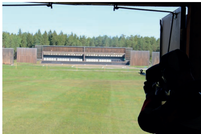
300 meterskytte, Livgardet.

Till sist ett stort tack till alla ideella krafter i föreningar och distrikt som bär vårt skytte framåt. Alla resultat hittar du i Gevärnssektionens speciella resultatbilaga.