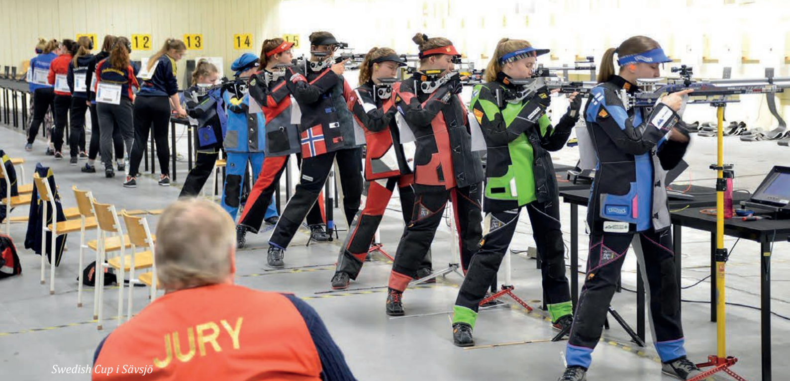
Swedish Cup i Sävsjö

Tävlingen är viktig för svenska skyttar, men också våra nordiska grannar poängterar att det är en viktig värdemätare och en viktig mötesplats.