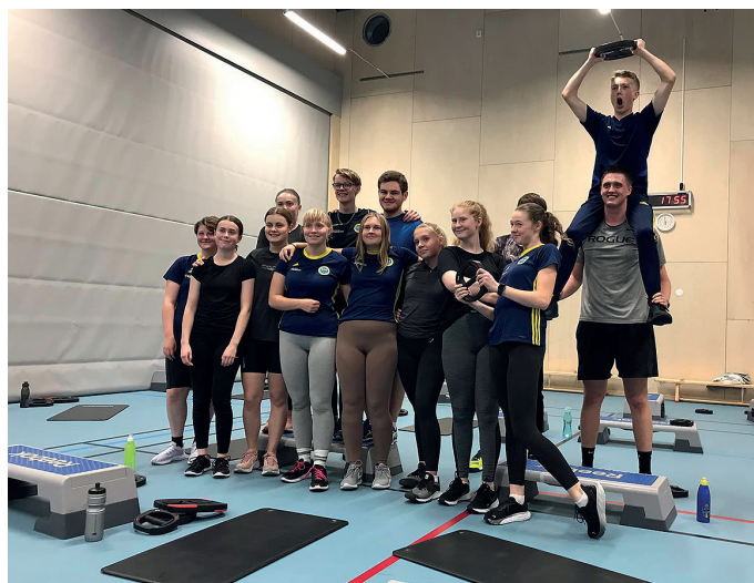
Fysträningen avslarad. Glada RIG-elever i Sävsjö.

Skolan har även kommit i gång igen med sina populära läger på loven. Under höstlovet samlades skyttar för att tillbringa fyra dagar tillsammans för att utveckla sitt skytte tillsammans med likasinnade. Detta fortsätter även under loven 2024.