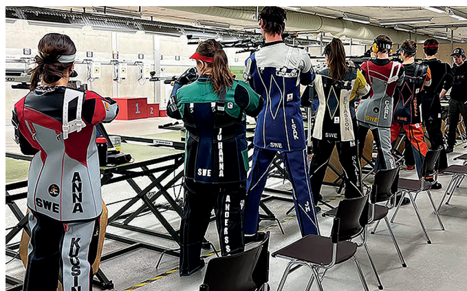
Träning i skjuthallen på Strömsunds skyttegymnasium.