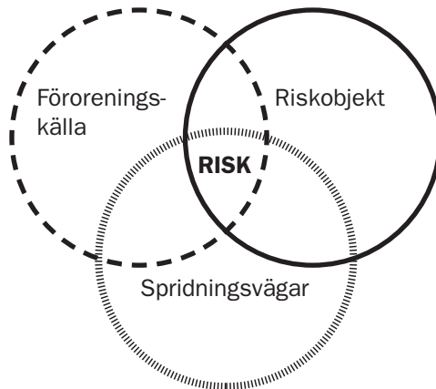
Figur 3. Illustration av miljö/hälsorisken av ett kulfång.

Negativ påverkan av en förorening i mark eller vatten kan enbart ske om föroreningen överstiger en viss halt, det finns ett riskobjekt samt en exponeringsväg mellan föroreningen och riskobjektet. Med andra ord, enbart förekomsten av en förorening innebär inte automatiskt en risk för påverkan. Detta har exemplifierats i Figur 3.