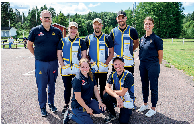
Pressträff inför OS på Uppsala JSK

Under det gångna året har vi även producerat en hel del videoinnehåll: en ny reklamfilm för Sävsjö Skyttegymnasium, informationsfilmer för ”Skytte för 65+”, vår nya organisation och paraskytte, samt instruktionsvideor för paraskytte (SH1, SH2 och SH3). Vi har även producerat ett videoreportage från Malmö Pistolklubb, som vann förstapriset i Kom till skott. Mer om detta nedan.