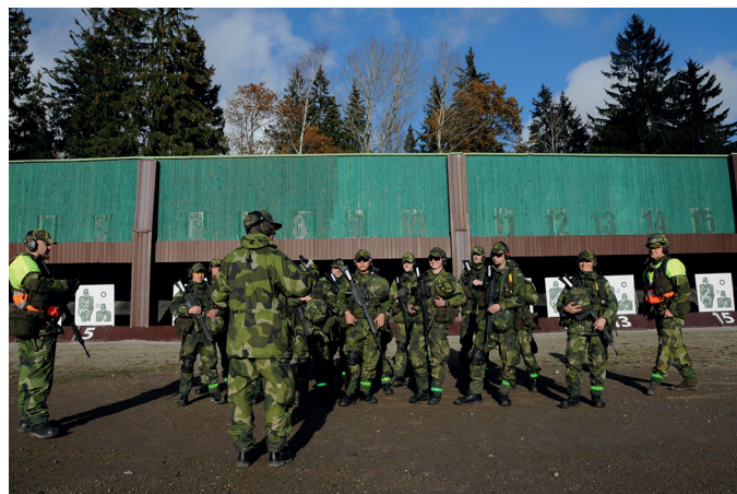
GU-F; Grundläggande soldatutbildning för frivilliga

Operation Interflex är en brittiskledd utbildningsinsats för att snabbutbilda ukrainska soldater.