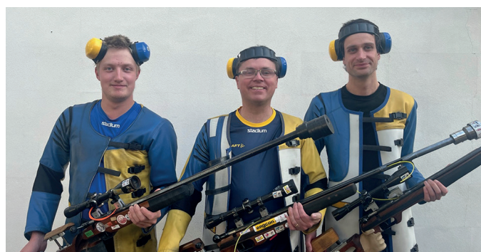
Svenska viltmåls herrarna skördade hela sju EM-medaljer i tjeckiska Plzen.